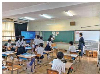
竹原市立中通小学校