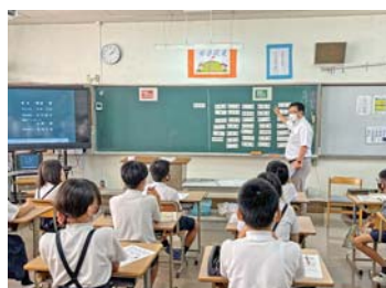
竹原市立竹原西小学校