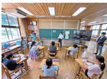
竹原市立仁賀小学校