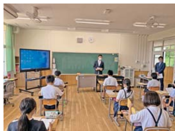
竹原市立吉名学園