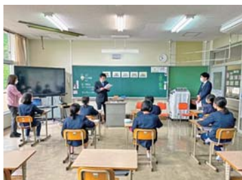
竹原市立東野小学校