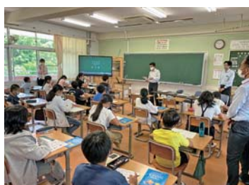
大崎上島町立大崎小学校