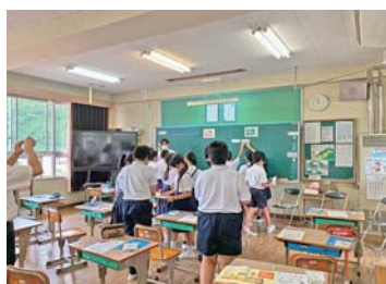
竹原市立荘野小学校