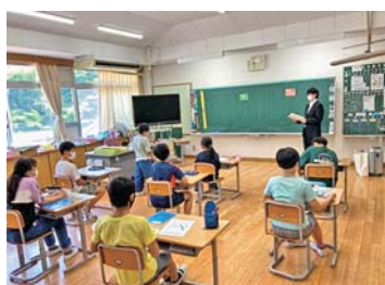
大崎上島町立東野小学校