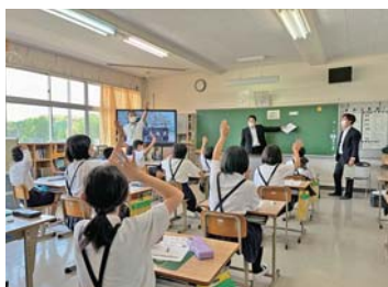
竹原市立大乘小学校