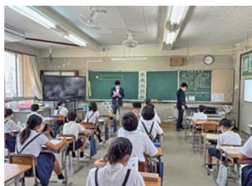
竹原市立竹原小学校